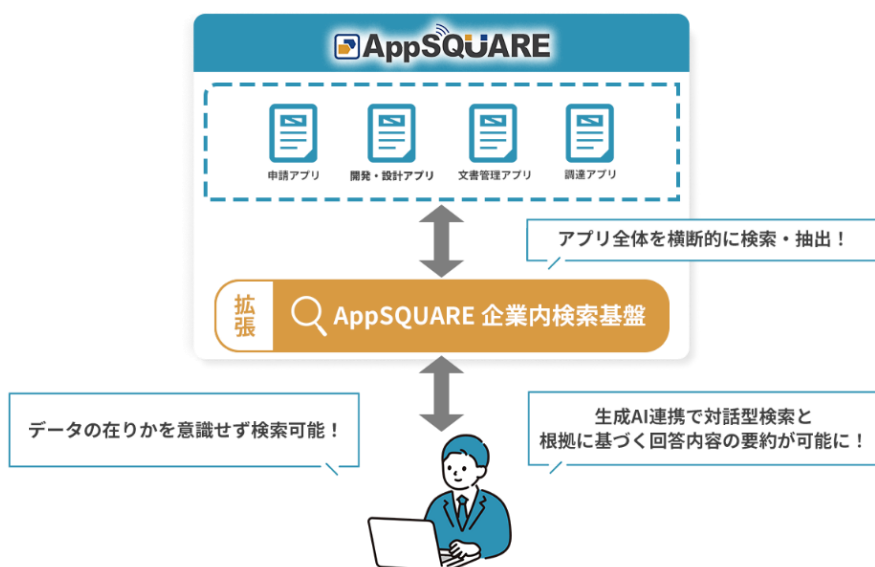
AppSQUARE 企業内検索基盤 利用イメージ