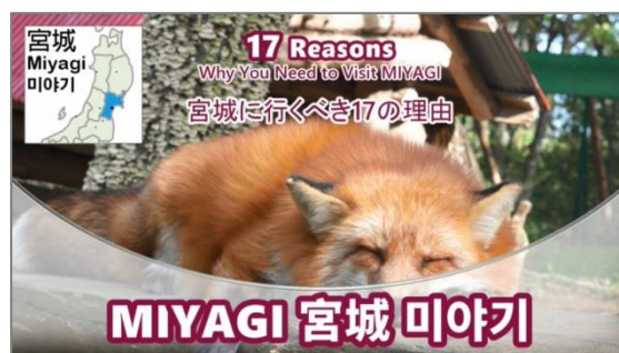
宮城県の観光スポット紹介ムービー