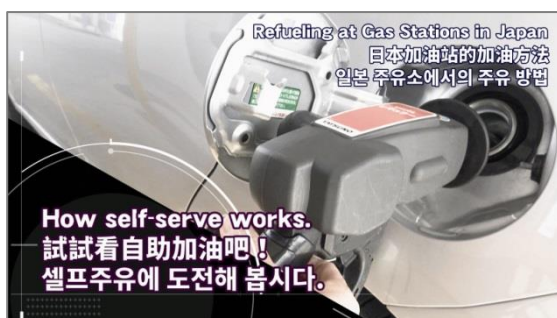
セルフスタンドでの給油方法解説ムービー