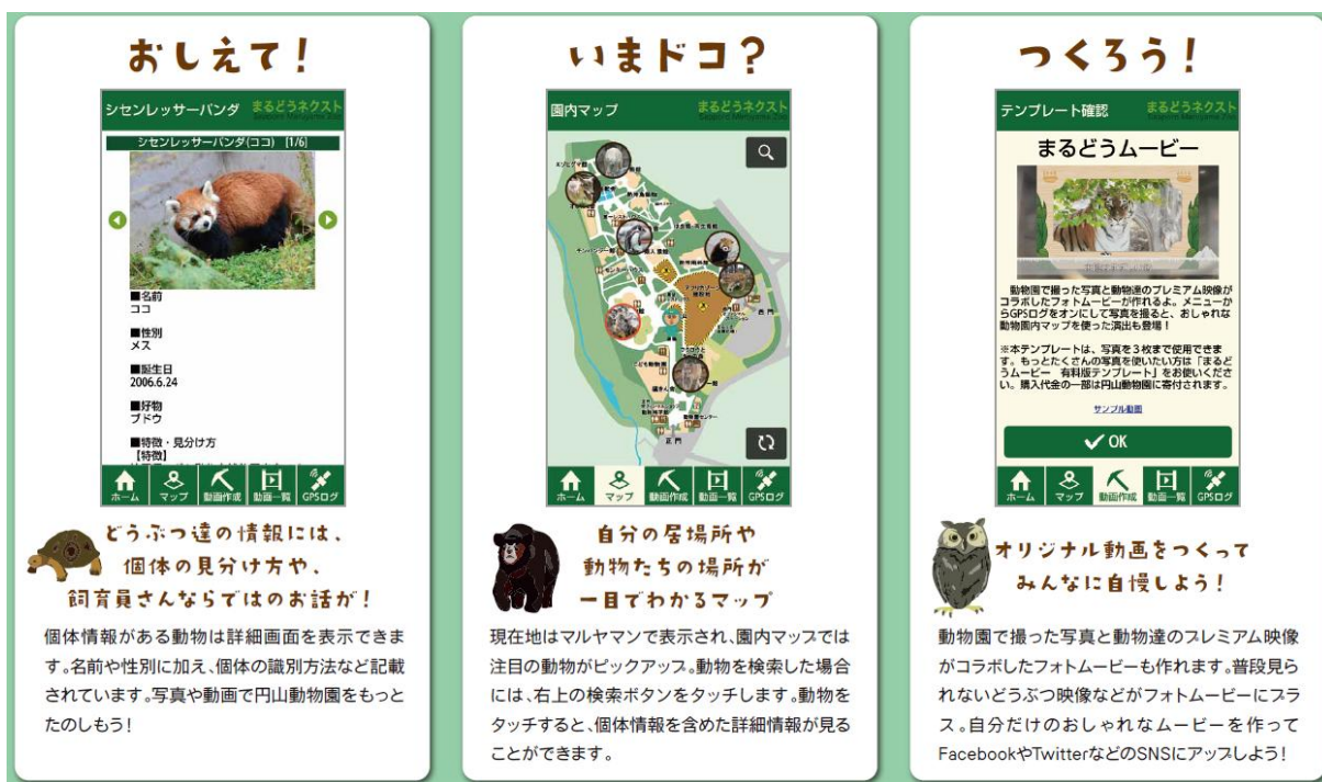
図1. プレミアム動画テンプレート スマートフォン画面表示例1

園内で撮影した写真を使ってプロ級のムービーを作成します。GPS 位置情報を使い、撮影場所に合わせて動画背景がスマートに切り替わる、日立ソリューションズ東日本の独自技術を使っています。動物園で撮影した写真を3枚までオリジナルムービーが作成できる無料版と、30枚までオリジナルムービーが作成できる有料版を提供します。(有料版の売上げの一部は札幌市円山動物園に寄付されます)