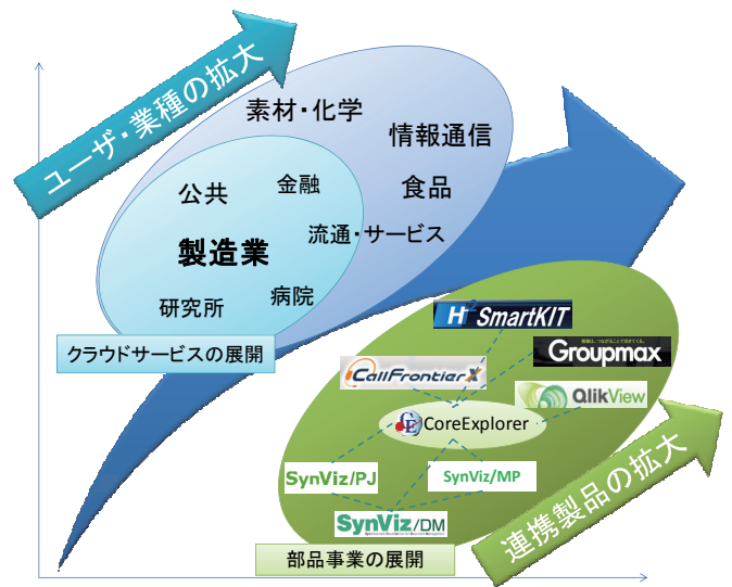
(C) 株式会社日立製作所, (C) 株式会社日立ソリューションズ (C) 株式会社日立ソリューションズ九州 (C) 日立 INS ソフトウェア株式会社

日立グループ内には、コールセンタシステムや、保全管理システム、電子帳票システム、といったテキストデータが蓄積される管理システムが多数存在している。これら製品にテキスト分析の機能を付加することで、管理から分析まで一貫したソリューションの提供が可能となる。このように CoreExplorer を部品として利用することが可能となると、付加価値の高いソリューションを提供していくことが可能となり、グループ全体の売り上げ拡大に貢献できるものとして期待できる。